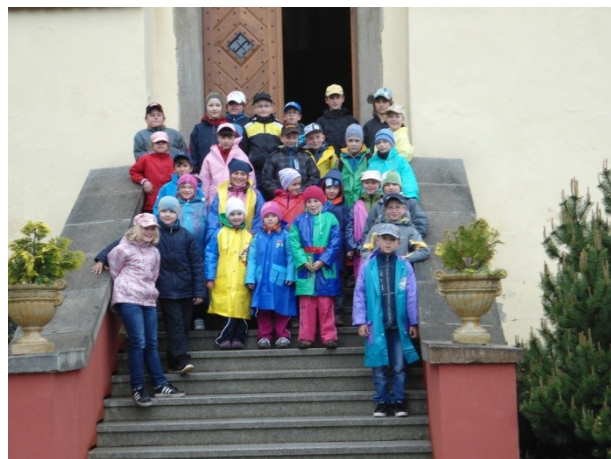
Školní výlet – hrad Kámen