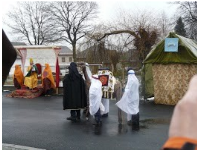
Hra „Čtvrtý z mudrců“ na návsi před školou u příležitosti zakončení Tříkrálové sbírky 2013.