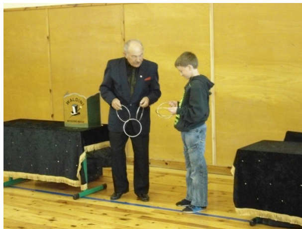
Kouzelník a jeho pomocník