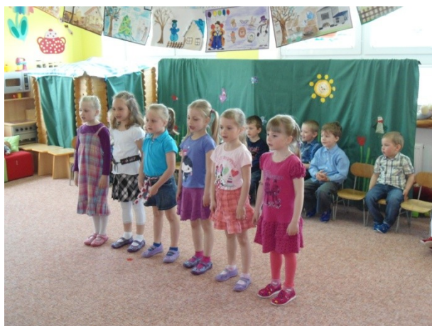
Besídka MŠ na Den matek

Také v letošním roce jsme začali se sběrem nepotřebných a vysloužilých elektrospotřebičů . Sběr bude probíhat až do konce prázdnin. Vybírají se drobné spotřebiče (žehlička, fén, mikrovlnka, topinkovač, holicí strojky, vysavač atd.), ledničky a mrazáky, pračky, myčky, ruční nářadí a nově i televizory a monitory. Veškeré elektro můžete uložit na školním dvorku.